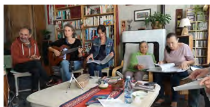
Chœur d'INCA en stage de perfectionnement

Novembre 2023 : duo Chechelos, deux violoncelles et deux voix qui ont subjugué le public avec leur talent et leur humour