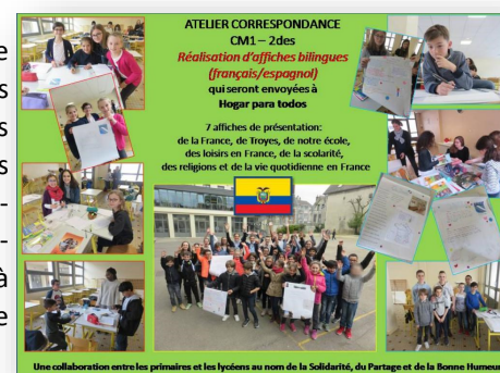
Une collaboration entre les primaires et les lycéens au nom de la Solidarité, du Partage et de la Bonne Humeur