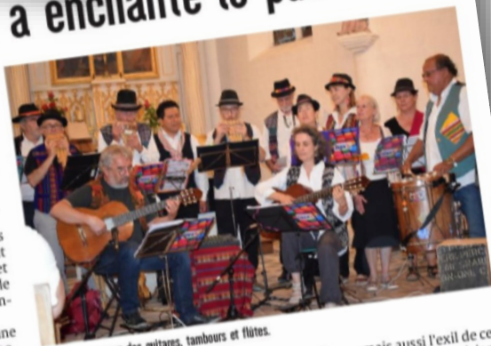
Un concert au son des guitares, tambours et flûtes.

Chœur d'INCA est une chorale formée par les membres de l'association Information et culture d'Amérique latine (INCA). Créée en 1984, cette association organise différentes activités pour diffuser la culture et les actualités d'Amérique latine, notamment des concerts, des expositions, des conférences, des projections de films. Grâce aux bénéfices des diverses actions, l'association INCA soutient divers projets à vocation sociale et culturelle dans des pays tels que le Chili, la Colombie, le Brésil, l'Argentine. Invités par l'association Patrimoine et Culture, une vingtaine de choristes et musiciens se sont produits récemment dans l'église de Luyères. La soixantaine de personnes ayant assisté au concert a pu effectuer un voyage dans les pays andins à travers une musique variée en rythmes et sonorités.