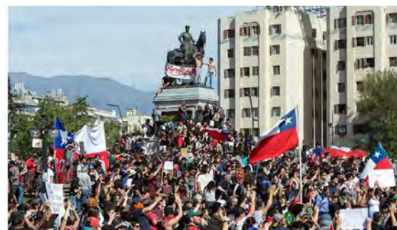
Explosion sociale au Chili en octobre 2019, quelques mois avant l'apparition de la pandémie de Covid-19 qui accentue les inégalités en Amérique latine.