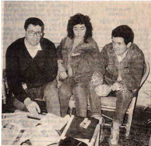
Le président du Tribunal aux côtés de prisonniers politiques chiliens

soutien international aux forces de renouveau démocratique du Chili, appuyé sur les diasporas d'exilés. Il fallait également lancer sans tarder une réflexion doctrinale sur la question du châtiement des crimes commis sous la dictature et sur celle de l'amnistie, à déterminer